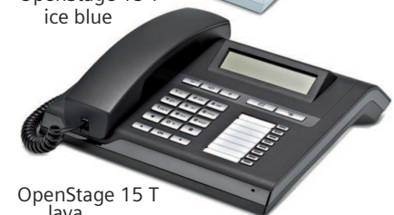
OpenStage 15 T lava