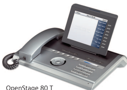
OpenStage 80 T