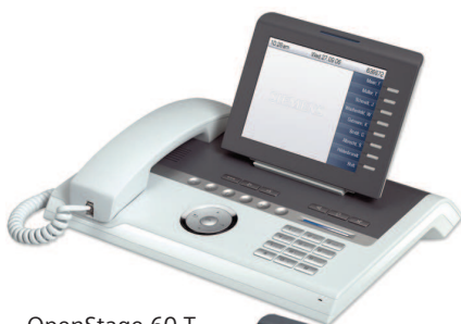
OpenStage 60 T ice blue