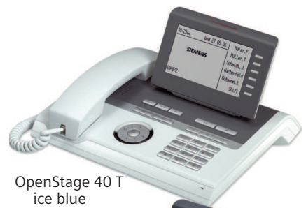
OpenStage 40 T ice blue