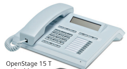
OpenStage 15 T ice blue