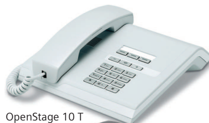
OpenStage 10 T ice blue

La compatibilité descendante des OpenStage 10 T, 15 T et 30 T permet à ces derniers d'être utilisés comme des téléphones optiPoint.