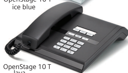
OpenStage 10 T lava