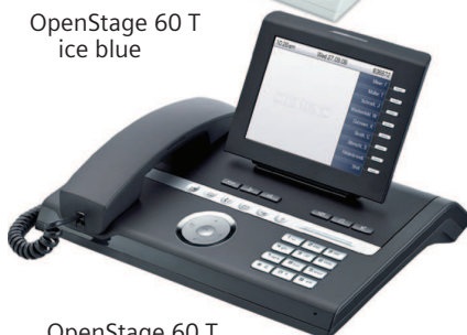
OpenStage 60 T lava