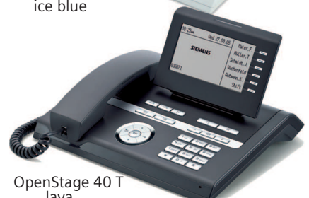
OpenStage 40 T lava