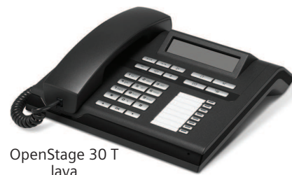
OpenStage 30 T lava