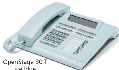
OpenStage 30 T ice blue