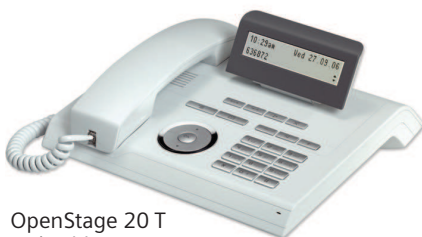
OpenStage 20 T ice blue