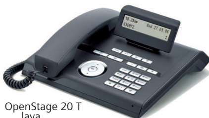
OpenStage 20 T lava